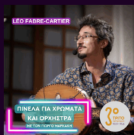
Μουσική Amazigh από το Μαρόκο | Πέμπτη 11 Ιουνίου 2026