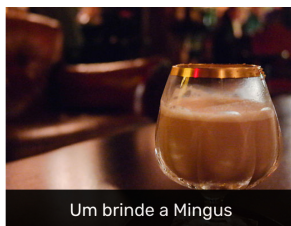
Um brinde a Mingus