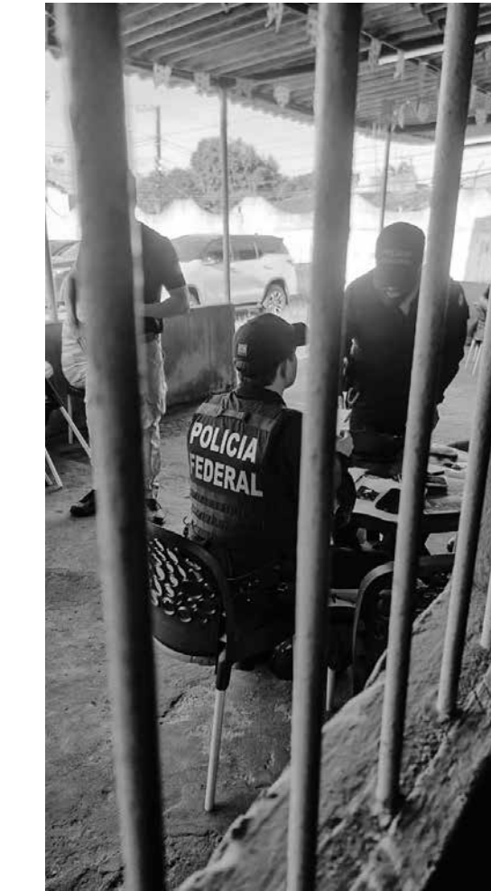
Operação Donos da Noite cumpriu nove mandados de busca e apreensão nos três estados

A atuação integrada visou crimes contra a dignidade humana, a organização do trabalho, a liberdade indi-