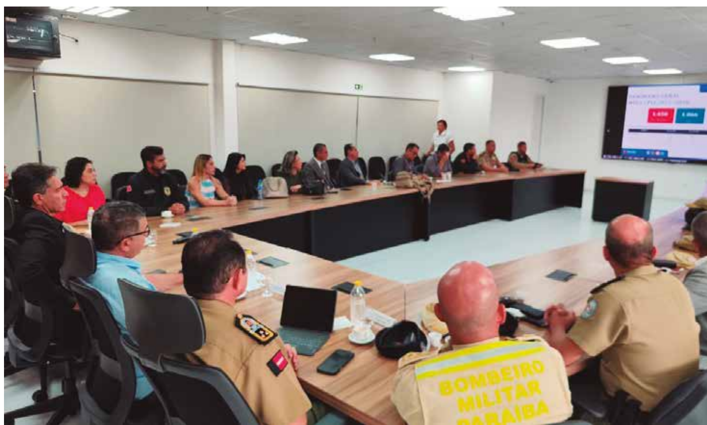
Reunião para acertar as ações das Forças de Segurança aconteceu no Centro Integrado de Comando e Controle, na capital

Durante a reunião, foram avaliados dados relacionados à dinâmica criminal da Região Metropolitana de João Pessoa, permitindo a definição de medidas operacionais voltadas ao reforço da presença das Forças de Segurança em áreas previamente mapeadas através do monitoramento e análise criminal. Entre as ações previstas, está a ampliação do policiamento ostensivo em bairros da região, com apoio de tro-