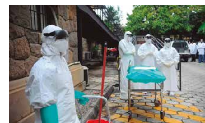
Instalação servirá para quarentena de estadunidenses

“O governo do Quênia optou, secretamente, em fazer esse acordo com o governo Trump para criar um centro de quarentena para todos os cidadãos norte-americanos no território africano que tivessem qualquer tipo de suspeita de ebola. É lógico que a juventude, e a população de Nairóbi, ficou muito apreensiva”, comenta.