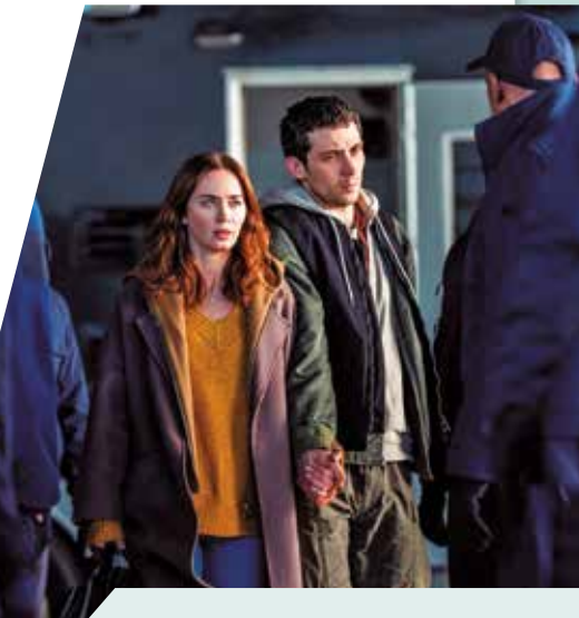
Blunt e Josh O'Connor são as pessoas comuns que lidam com grandes acontecimentos

Em 18 de dezembro, Steven Spielberg completa 80 anos e, claro, é um homem sensivelmente diferente daquele que rodou Contatos imediatos do ter-