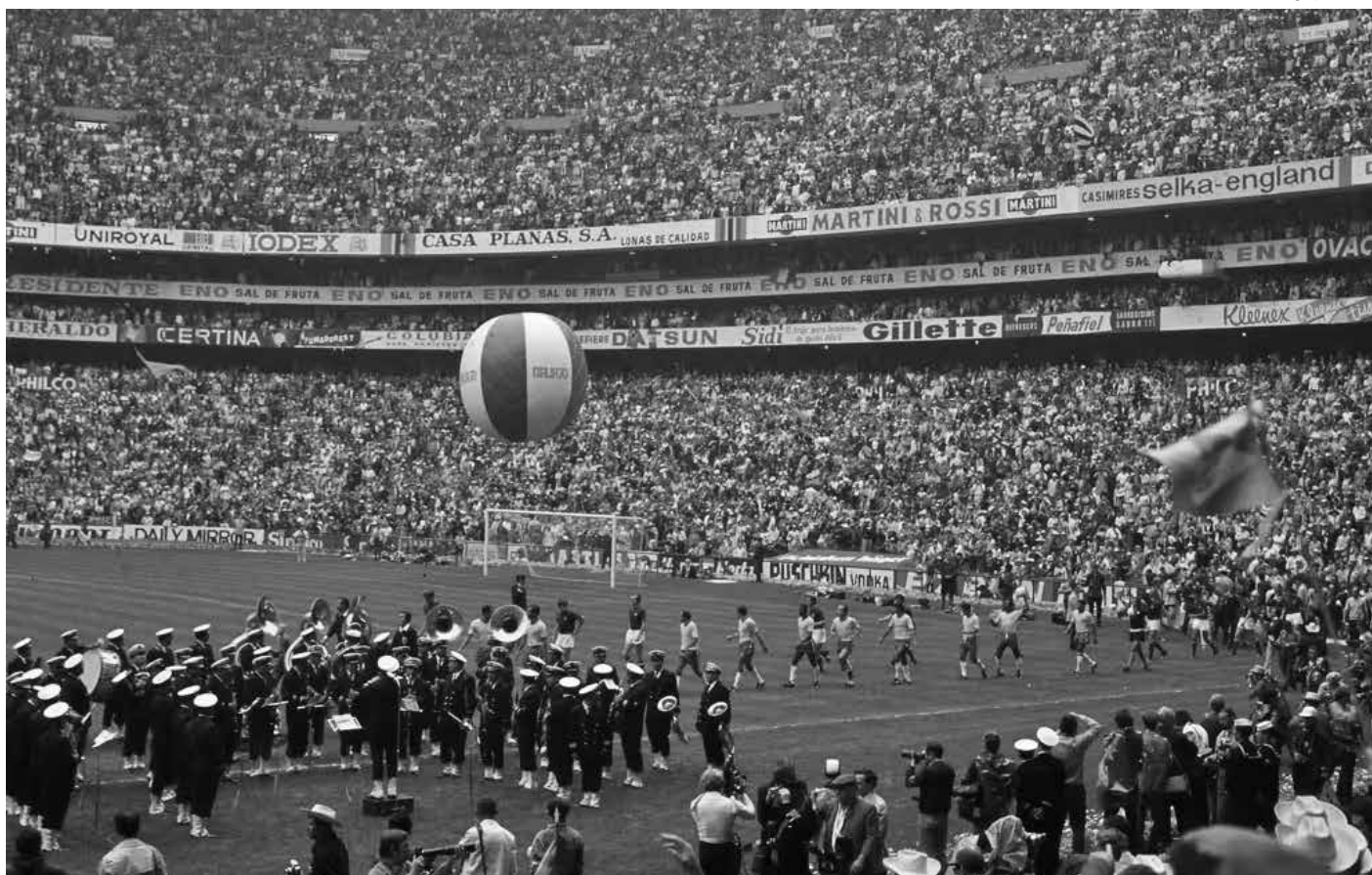
Jogadores do Brasil e da Itália entram em campo para a decisão da Copa do Mundo de 1970, no Estádio Azteca, no México