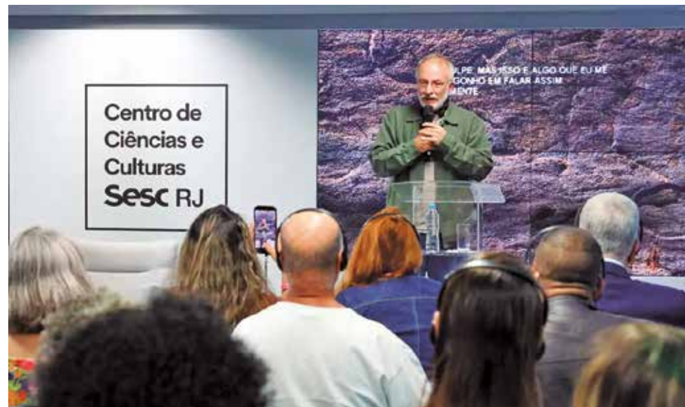
Professor da Universidade de Florença, Mancuso ministrou palestra no Rio de Janeiro

De acordo com as pesquisas de Mancuso, as plantas apresentam inteligência descentralizada e cooperativa. A tomada de decisões no reino vegetal ocorre de maneira distribuída por todo o organismo, princi-