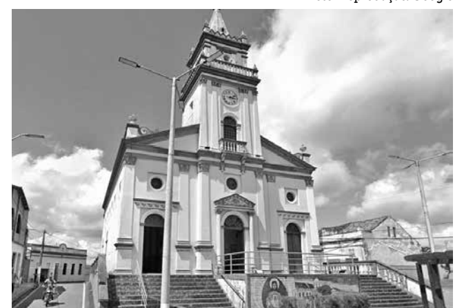
Igreja de Serraria: “beleza arquitetônica imensurável”