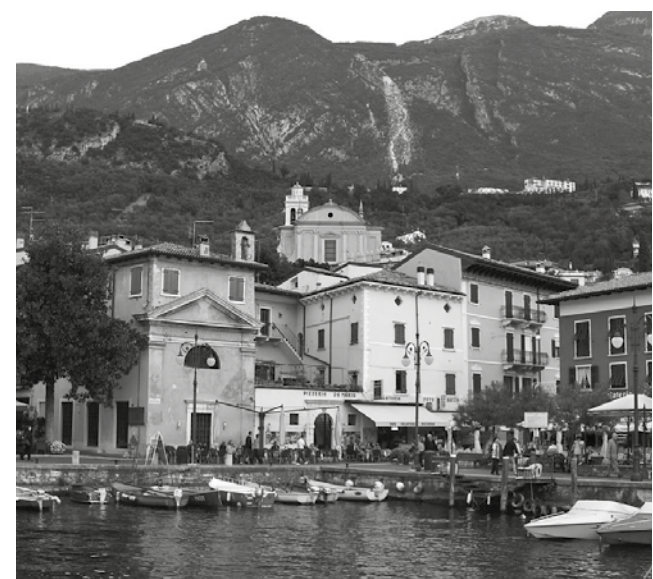
Malcesine: os reflexos de beleza nas águas cristalinas