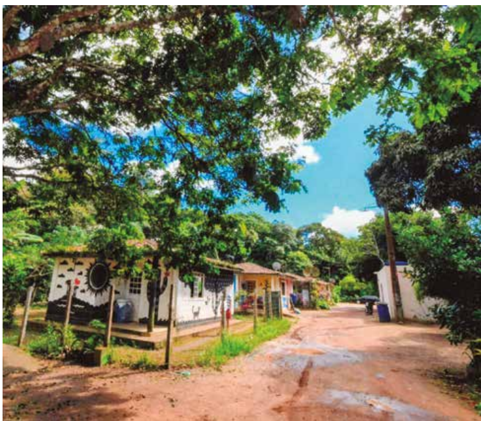
Parque Estadual Mata do Pau-Ferro receberá R$ 3,8 milhões em investimentos