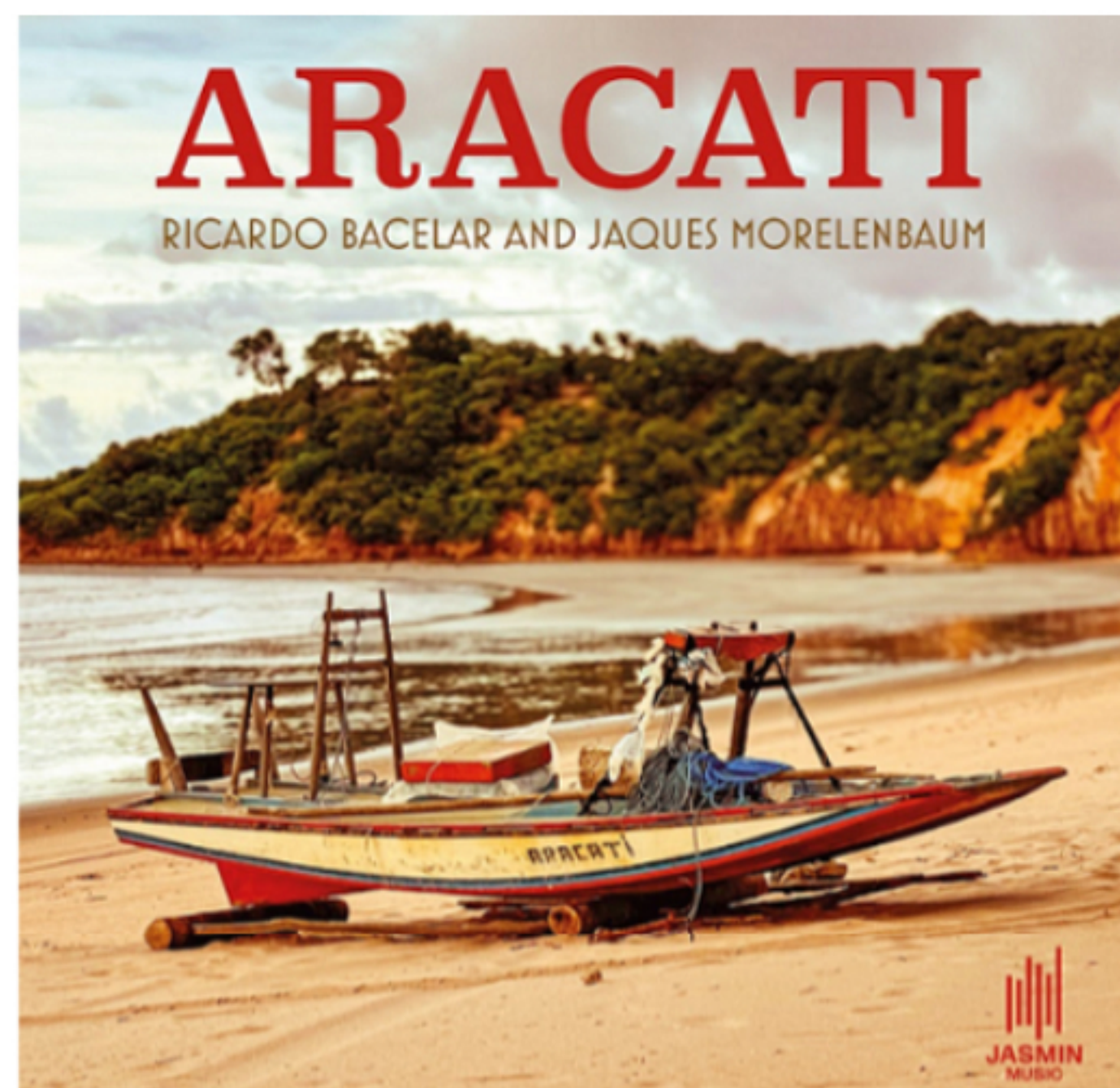
Capa do álbum instrumental "Aracati"

Para Jaques Morelenbaum, a estadia no litoral cearense foi mesmo mágica: "Todas as composições que surgiram durante a nossa estadia em Aracati se relacionam com eventos que se sucederam, como quando a gente compôs 'Fogueira'. Sentimos a presença do Egberto Gismonti na inspiração da música, até por ser um baiano. Durante um evento na praia, quando se acendeu uma grande fogueira, Ricardo e eu ouvimos essa música na nossa cabeça". O tema ganhou videoclipe, a ser lançado junto com o álbum, no dia 29.