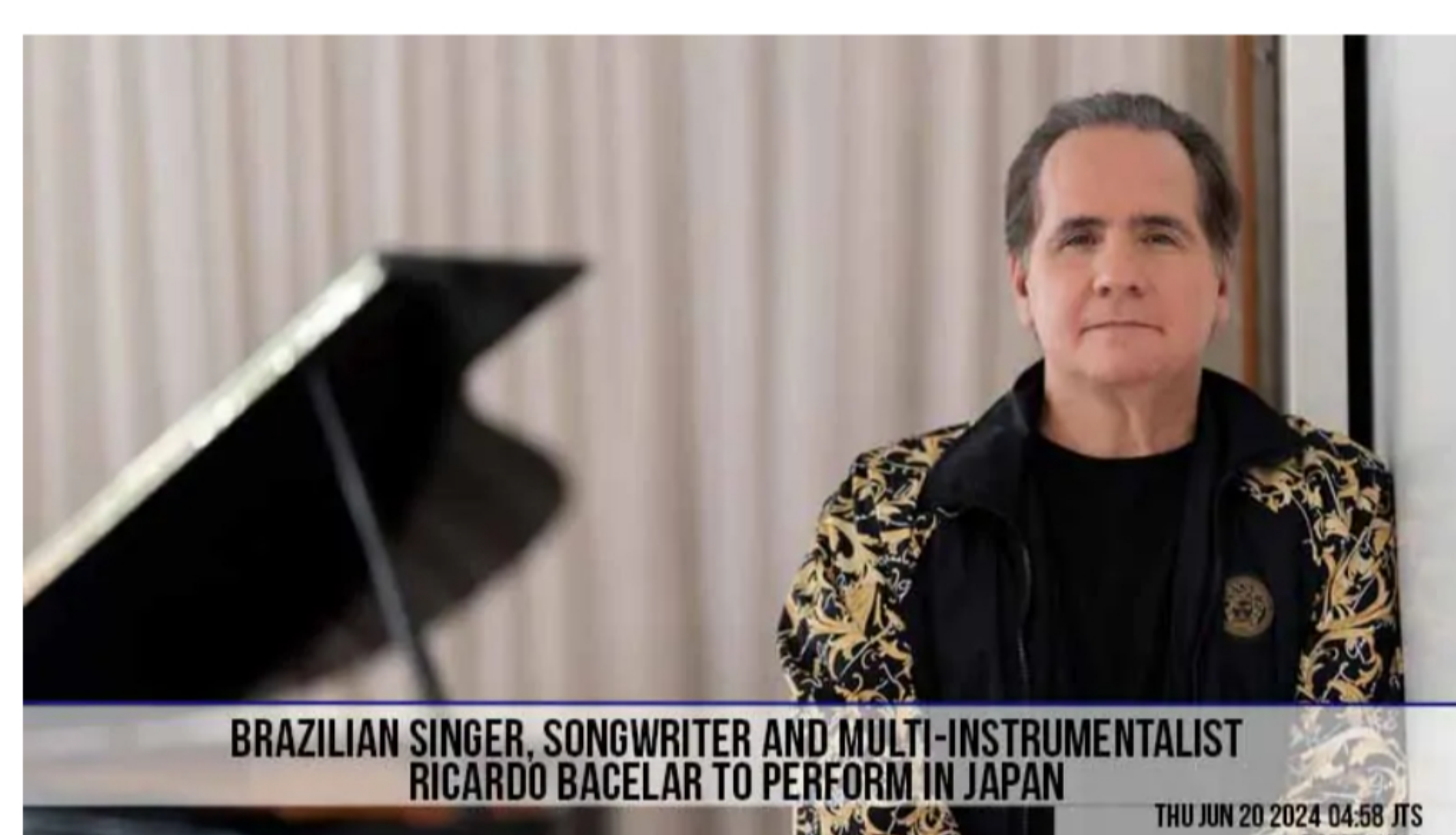
BRAZILIAN SINGER, SONGWRITER AND MULTI-INSTRUMENTALIST RICARDO BACELAR TO PERFORM IN JAPAN

BY RADIO SHIGA 20 DE JUNHO DE 2024 5:25 AM