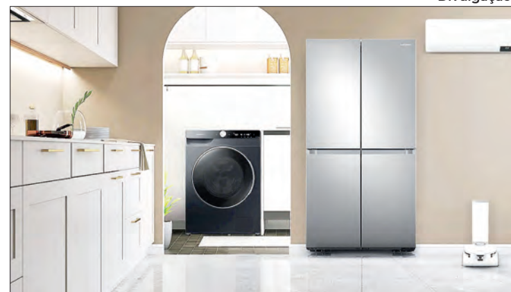
Venda de eletrodoméstico foi 13% mais alta neste semestre

As vendas da indústria de eletroeletrônicos para o varejo brasileiro cresceram 13% no primeiro semestre, na comparação com o mesmo período do ano passado, segundo dados divulgados pela Eletros (associação do setor que representa marcas como Samsung, LG e Philips). Foram mais de 44 milhões de unidades comercializadas de janeiro a junho