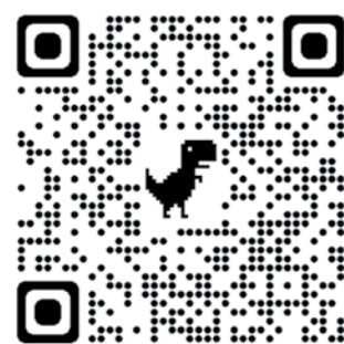
Através do QR Code acima, acesse as principais plataformas para a audição